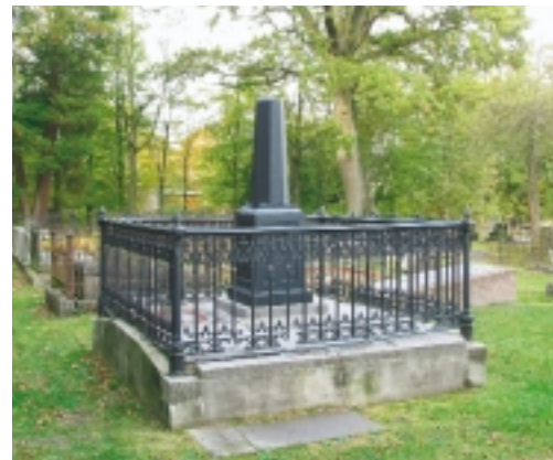
In sommige gevallen zijn individuele grafmonumenten expliciet beschermd op grond van hun unieke waarde. De grafmonumenten die om zo'n beschermd monument heen staan, zijn dan wel degelijk van belang voor het totale beeld. Grafmonument Van Bulderen op de Noorder-begraafplaats te Assen

Een van de meest gestelde vragen van beheerders en eigenaren van begraafplaatsen gaat over subsidies. Voor onderhoud of restauratie is vaak veel geld nodig. De overheid heeft wel mogelijkheden geschapen om restauraties financieel te ondersteunen, maar de vraag is meestal groter dan het aanbod. Primair is de eigenaar verantwoordelijk voor de instandhouding van zijn bezit. Hij dient te zorgen voor goed onderhoud en zonodig voor restauratie. De overheid kan hierin financiële ondersteuning geven, maar het huidige stelsel daarvoor is te ingewikkeld en staat te ver af van de praktijk. Het is de bedoeling dat per 1 januari 2006 de huidige regelingen (Brrm 1997 en Brom) vervangen worden door het Besluit rijkssubsidiëring instandhouding